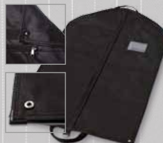
Schwarz – hochqualitativ, praktisch und strapazierfähig