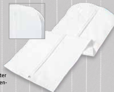
Weiß – extra lang und mit besonders breiter Seitenfalte