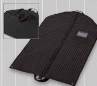
Schwarz – edles Design in Nadelstreifen-Optik