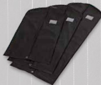
Schwarz – klassisch, in 3 verschiedenen Längen erhältlich

Länge 110 cm Artikel-Nr. 116-4119 Länge 135 cm Artikel-Nr. 116-4120 Länge 165 cm Artikel-Nr. 116-4121